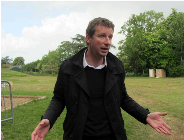
Yannick Jadot dans le parc de la Deniserie, avant son meeting.

Samedi 26 avril, le groupe départemental d'Europe Écologie-Les Verts a organisé à Chalonnnes, dans le parc de la Deniserie, une Fête de l'écologie proposant stands, conférences et un concert gratuit en soirée. Avec en prime un meeting de Yannick Jadot, actuel député européen du Grand Ouest, qui se présente à nouveau le 25 mai à la tête d'une liste EELV. Partisan d'une Europe souveraine et protectrice, à la pointe du combat pour les libertés et l'écologie, Yannick Jadot n'a guère trouvé à Chalonnnes une mobilisation à la hauteur des résultats des élections de 2009.