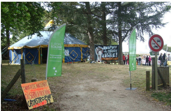
Le chapiteau de L'Échap'ment a accueilli conférences et concerts.