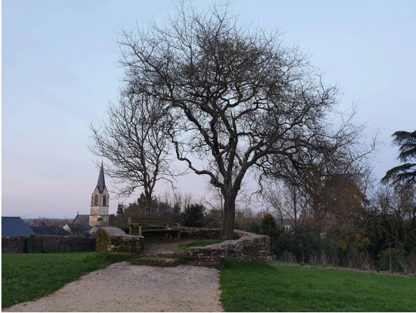
27 janvier 2020. Parc de la Deniserie