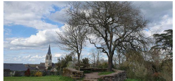
27 mars 2023. Parc de la Deniserie