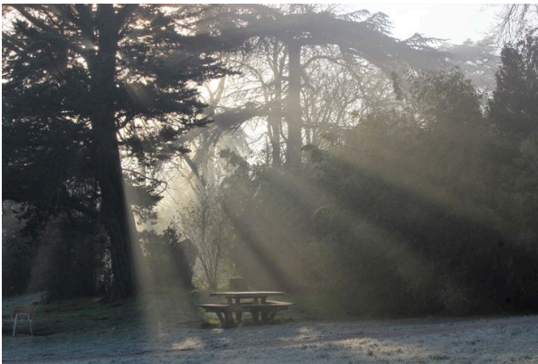
11 février 2021. Parc de la Deniserie